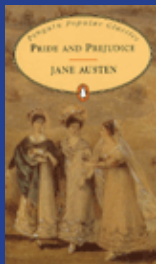
Austen, Jane: Pride and Prejudice