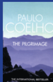
Coelho, Paulo: The Pilgrimage