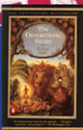
Ende, Michael: The Never- endig Story