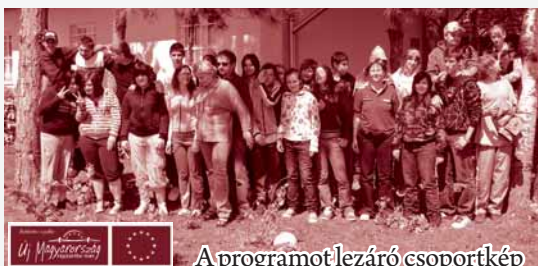
A programot lezáró csoportkép

Szivárvány: gyermekek és fiatalok kábítószer-prevenációs programjai Mórahalmmon. 2009. júniusában a mórahalmi gyerekek élménypedagógiás kiránduláson vettek részt az Erdei Iskola és Zöld Közösségi Házban. A 2 napos program játékos formában biztosított lehetőséget a prevenációs ismeretek elsajátítására. A program a TÁMOP 5.2.5. pályázati konstrukció keretében valósult meg az Esély Mórahalmi Szociális Magánalaptípusú szervezésében.