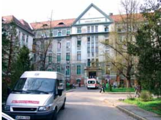
A mentőben lévő ágy egyelőre még marad