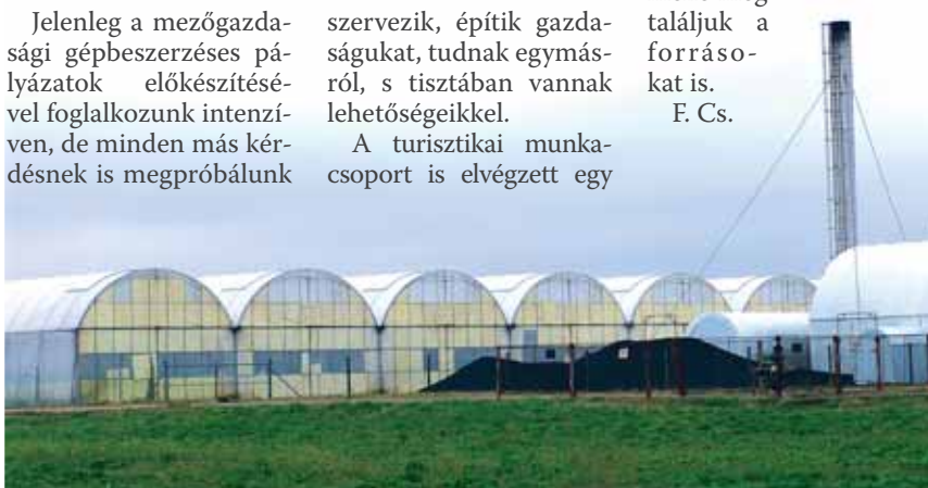
Pályázatíró munkacsoport segít a gazdáknak az EU-s források megszerzésében