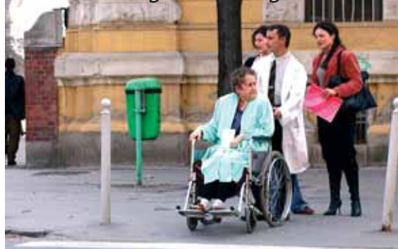
Bizonytalan betegek és dolgozók az egészségügyben