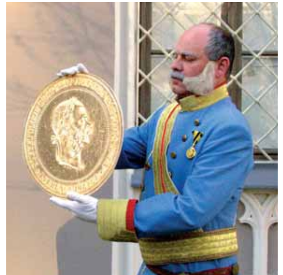
„Ferenc József” az érme másolatával a múzeum ünnepségén

A Ferenc József képmásával vert érmén olvasható a király híressé vált mondása: „ Szeged szebb lesz, mint volt ”. Ezt az uralkodó a nagyárvíz által romba döntött várost látva mondta. A király az 1879. március 12-ei pusztító árvíz után néhány nappal személyesen látogatta meg Szegedet . A korabeli beszámolók szerint leírhatatlan tapasztaltak; a város hatezer házából alig 260 maradt meg, a hivatalos számok közel kétszáz halottról szólnak. Ferenc József elkötelezett volt Szeged újjáépítését illetően, személyesen felügyelte a munkákat. 1883-ra a város újjászületett, ebből az alkalmából az államfő ismét eljött Szegedre . Az ese-