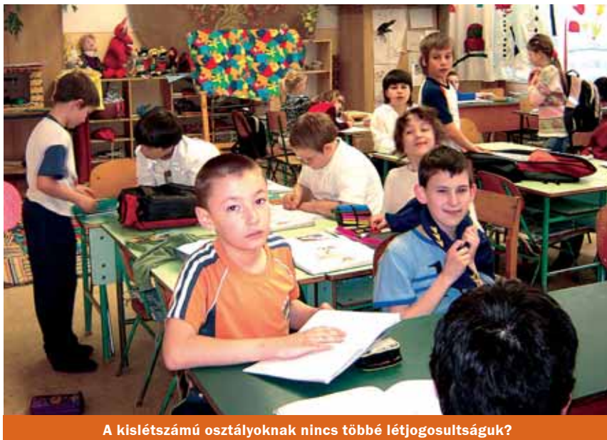
A kislétszámú osztályoknak nincs többé létjogosultságuk?

Mint megtudtuk, a napközit megszüntették, csoportösszevonások lesznek, illetve március 31-től bezárják a bölcsődét is, melynek fenntartása az önkormányzatnak évi hét millió forintjába került. A kisegítő munkatársak között a legnagyobb az elbocsátottak száma, de az óraszámok emelkedése és a kormány intézkedései miatt az intézmény vezetői óvoda-, illetve iskola-