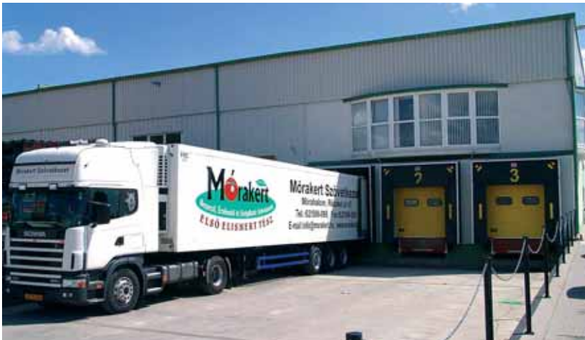
Az ország útjain gyakran találkozhatunk a Mórakert kamionjaival

Új vállalkozásba kezdett a Mórakert Szövetkezet, többségi tulajdonosa lett a PH-Centrum Kft.-nek. Ezzel közvetett módon a zöldség- és gyümölcsstermékek feldolgozására szakosodott kft. a térség termelőinek tulajdonába került.