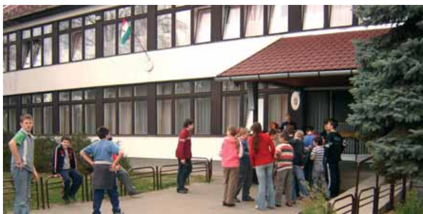
Nem lesz-e kihatással a gyermekek tanulmányi eredményeire a kialakult helyzet?

Döntéskényszerben az ásotthalmi testület