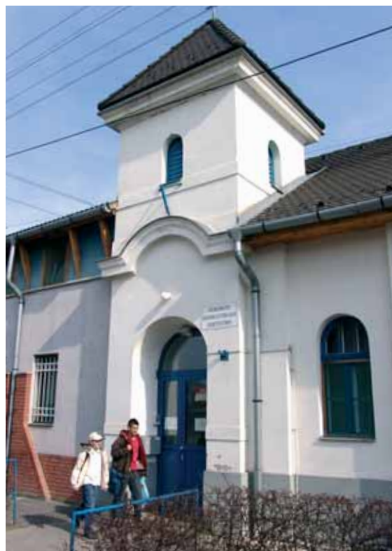
Veszélyben az időskori ellátás

Minden szociális intézmény, így a Harmat utcai szeretetotthon is szívesen vesz bármilyen ado-