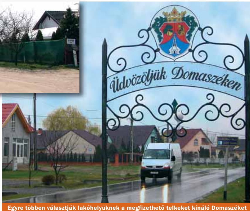
Egyre többen választják lakóhelyüknek a megfizethető telkeket kínáló Domaszéket

Subasára és Sziksóstóra is be lehet jelentkezni állandó lakosként, jelenleg közel hatszázan élnek e területeken. Az itt lakók számára az jelentene kiutat, amennyiben a város lakóövezetté nyilvánítaná Subasát és Sziksóstót. Ennek viszont feltétele, hogy megtörtén-