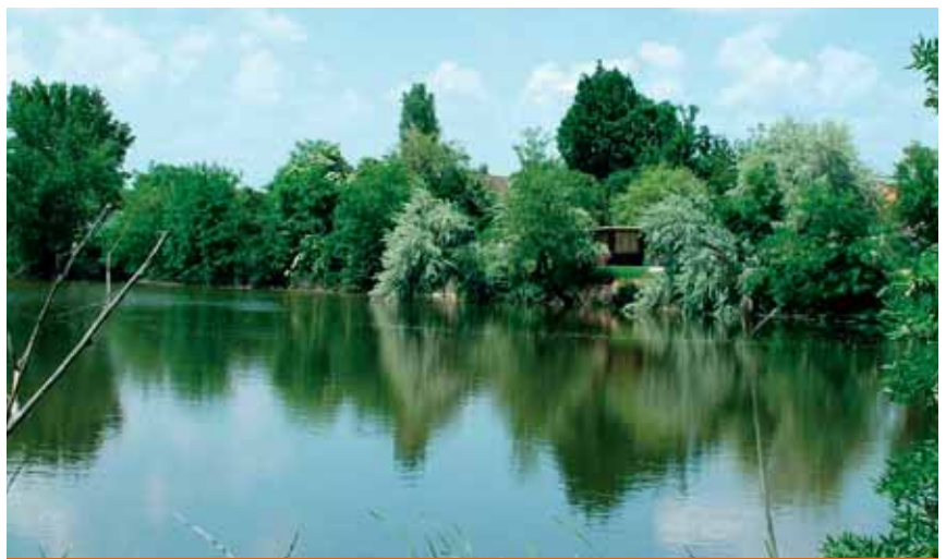
A röszkei Holt-Tisza-ág turistaparadicsommá válhat az elkövetkezendő években

A LEADER+ program közösségi kezdeményezés, része az Európai Unió vidékfejlesztési politikájának. Célja a vidéki szereplők ösztönzése és támogatása a térség hosszú távú lehetőségeiről történő együttgondolkodásban. A LEADER a helyi akciócsoportok által kidolgozott vidékfejlesztési programokat támogatja. A helyi akciócsoportok felelősek a helyi vidékfejlesztési terv elkészítéséért, a helyi pályázati rendszer működéséért a terv megvalósítása érdekében. A Déli Napfény Hagyományörző LEADER+ Térség Akciócsoport hét települése ( Algyő, Bordány, Domaszék, Röszke, Sándorfalva, Szatymaz, Zombó ) kilencvenmillió forint támogatást nyert arra,