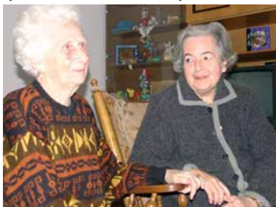
Az idős beteg embereket újabb terhekkel súlytják