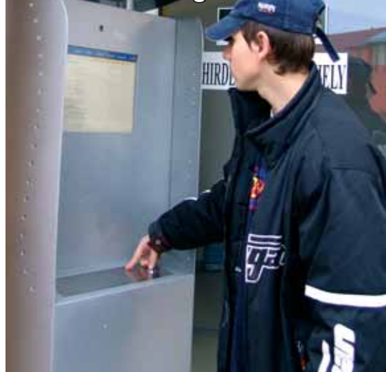
Népszerűek az utcán elhelyezett számítógépek

Bizonyára mindenkinek vannak emlékei a hivatali ügyintézés körülményeiről. Sorban állás, igazolások pótlása, ügyfélfogadás előre egyeztetett időpontban, hosszadalmas ügyintézés. Hamarosan mindennek vége szakad a Homokhátságon. A helyi önkormányzatok társulása az elektronikus szolgáltatások fejlesztésére kiírt európai uniós pályázaton 469 millió forintot nyert.