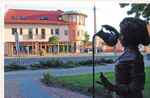
Utcarészlet szoborral, parkkal