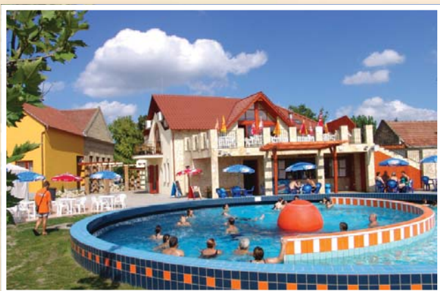
Négycsillagos Erzsébet Mórahalmi Gyógyfürdő