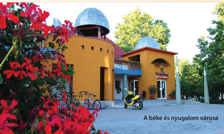
A béke és nyugalom városa