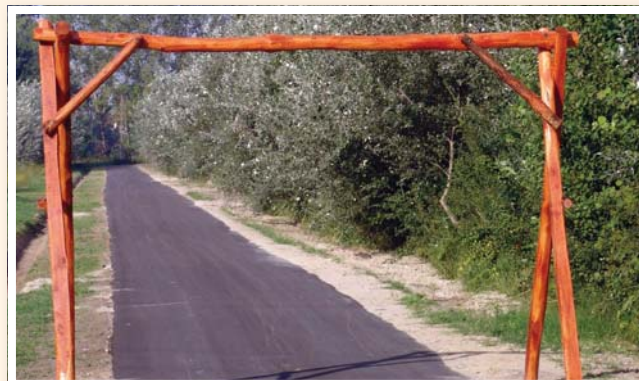
Kerékpárút, amely a kisvasút nyomvonalán vezet végig a széksósi szálláshelyig.

Széksósón ifjúsági szálláshely és ökoház épült, ahova kerékpárúton juthat el a természetet kedvelő turista. A széksósi látóvalók közé tartozik a vizes élőhelyek rehabilitációjára kialakított bivalyrezervátum kilátókkal, szakavatott túravezetéssel, ahol a kíváncsi természetbúvárok megismerhetik ennek a tájvédelmi körzetnek látnivalóit, ritka természeti értékeit.