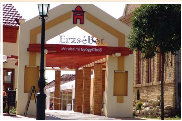
A fürdő nyári bejárata és az Erzsébet Kávézó