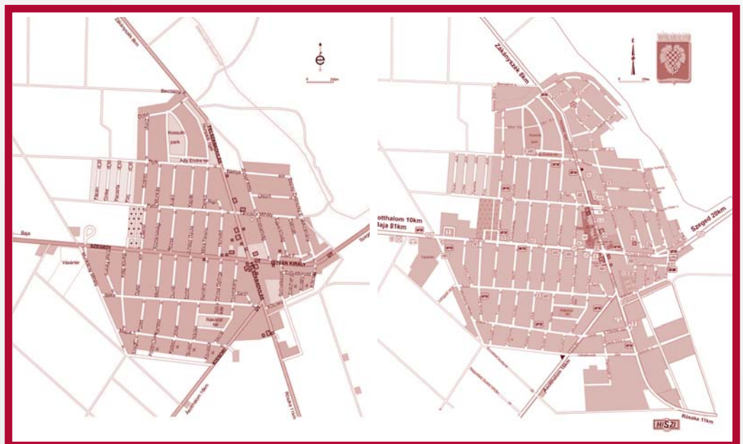
Összehasonlításként két térkép, az egyik a város belterületének nagyságát ábrázolja 1989-ből, a másik napjainkból.