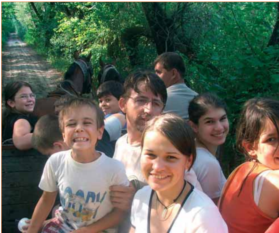
Ifjúsági tábor Pusztamérgesen

Legnagyobb rendezvényünk az Ifjúsági Focibajnokság, amely minden évben, júliusban kerül megrendezésre 2008-ban immár a 7. alkalommal. Itt vegyes és férfi kate-góriában lehet nevezni. Mindkét kate-góriában vándorszerleget kapnak a győztes csapatok. A mini sportnapra amatőr, 5+1 fős csapatok jelentkezését várjuk.