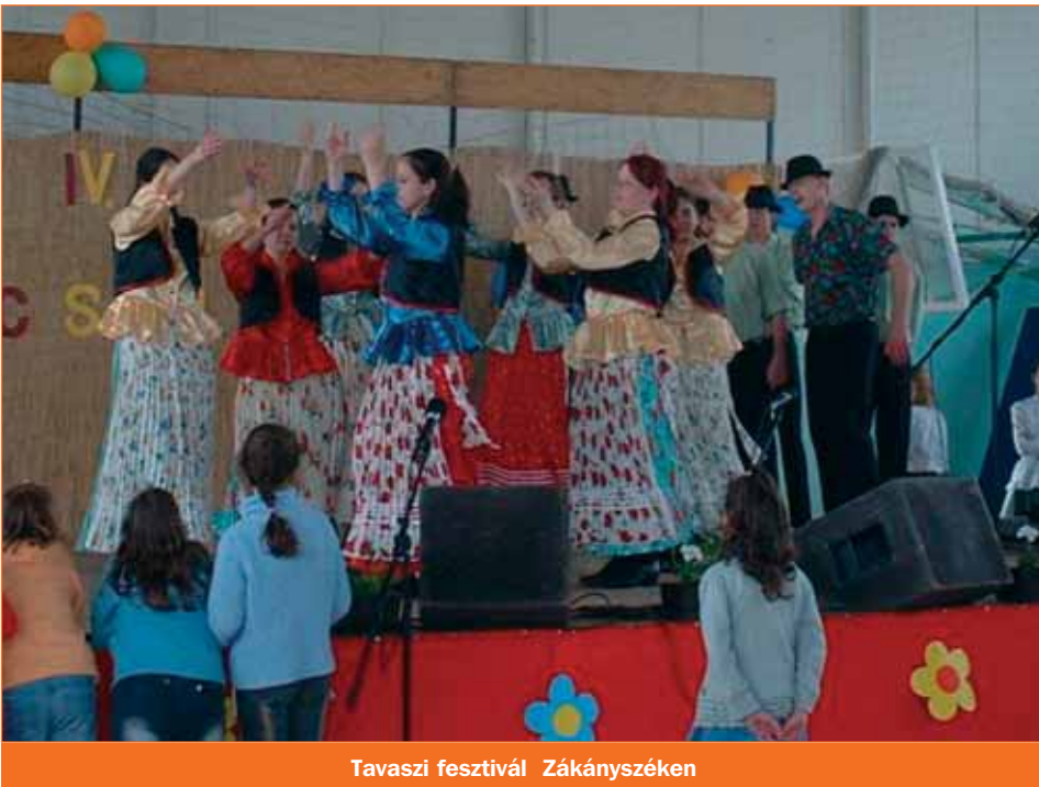
Tavaszi fesztivál Zákányszéken