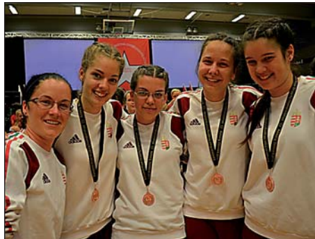
A boldog első EB érmesek