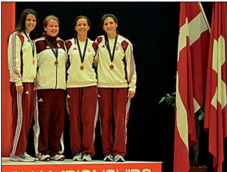
Petrák a dobogón