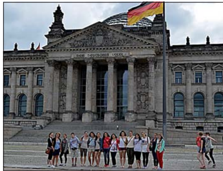
A berlini Reichstag előtt