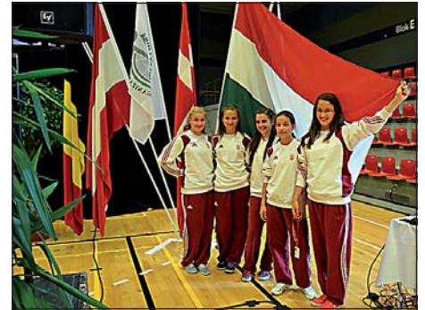
Lányaink a lobogóval