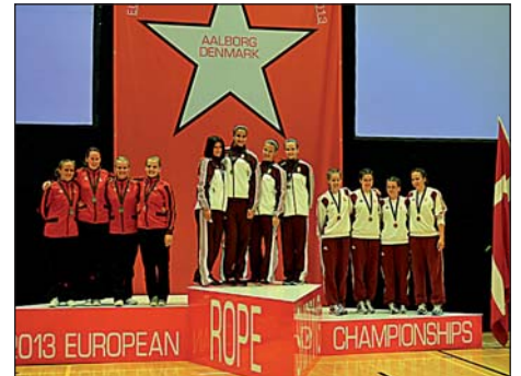
Vikiék a dobogón