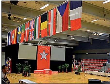
Küzdőtér az Arénában