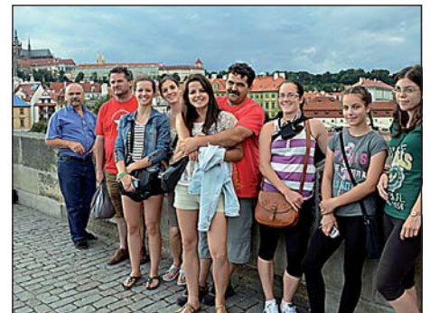
Prágában a Károlyi hídon