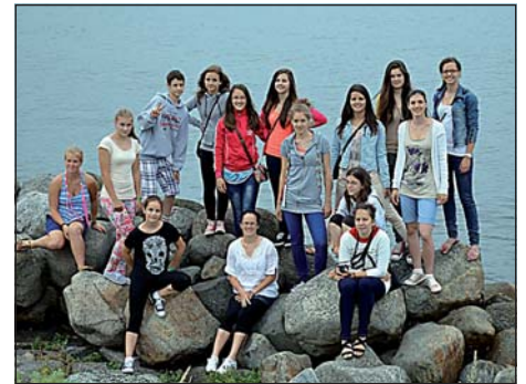
Csapatunk a dán parton