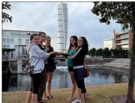
Tenyerünkön a malmői csavart torony