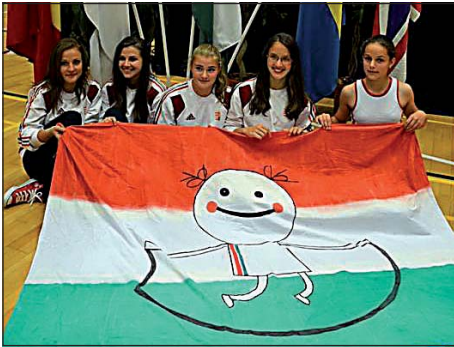
Lányaink a zászlónkkal